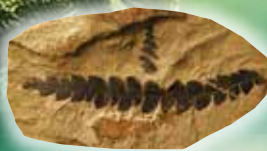
ナウマンヤマモモ (秋田県)