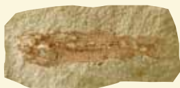
青森県指定天然記念物 アオモリムカシクジラウオ 青森県の石 (化石)