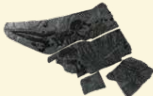
ウタツギヨリュウ (レプリカ) 宮城県の石 (化石)