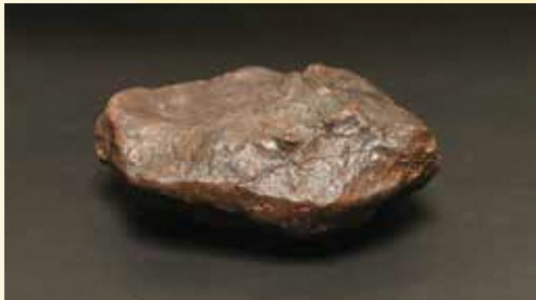
天童隕石 (レプリカ)