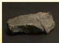
鉄鉱石 岩手県の石 (鉱物)