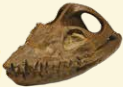
フタバズキリュウ (レプリカ) 福島県の石 (化石)