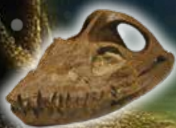
フタバズスキリュウ (福島県)