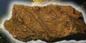
シルル紀のサンゴ化石群 (岩手県)