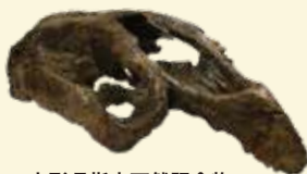
山形県指定天然記念物 ヤマガタダイカイギュウ 山形県の石 (化石)