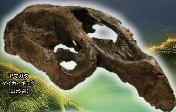
ヤマガタ ダイカイギョウ (山形県)