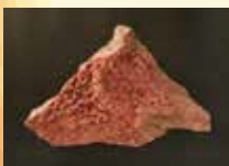
菱マンガン鉱 青森県の石 (鉱物)