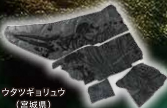
ウタツギョリュウ (宮城県)