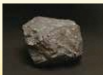
黒鉱 秋田県の石 (鉱物)